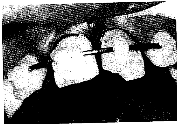
تصویر شماره ۳- جایگزینی دندان و قرار دادن اسپلینت

در کنترل ۳ ساله دندان از نظر کلینیکی کارایی خوبی داشت ولی به وضوح نسبت به دندانهای مجاور دچار Infraposition شده بود. تحلیل منتشر استخوان که جزئی از روند تحلیل جایگزینی می‌باشد در اطراف ریشه دندان مشاهده شد (تصویر شماره ۶-ب).