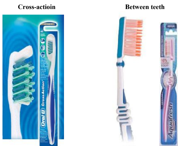
شکل ۱- مسواک‌های مورد مطالعه

ارایه مسواک (Aquafresh Co, England) Between teeth با هدف کارایی بالاتر در برداشت پلاک بخصوص از نواحی بین‌دندانی محور اصلی انجام این مطالعه است. طول سر مسواک ۲۹ میلی‌متر و عرض سر مسواک ۱۲ میلی‌متر است. این مسواک دارای ۴ ردیف و در هر ردیف ۱۲ دسته تافت و در هر تافت ۶ بریستل با طول بیشتری نسبت به سایر بریستل‌ها قرار گرفته و شرکت تولید کننده مدعی است وجود همین بریستل‌های طویل باعث برداشت بیشتر پلاک به خصوص از نواحی بین‌دندانی شده و نیاز به استفاده از نخ دندان را از بین می‌برد. از آن‌جا که کاربرد نخ دندان در بیماران با مشکلاتی همراه است و نیاز به داشتن مهارت کافی دارد، از طرفی در مطالعات گذشته برتری مسواک Cross action (Oral-B Co, England)، طول سر مسواک ۲۷ میلی‌متر و عرض آن ۱۲ میلی‌متر دارای Unituft در سر مسواک و دارای ۳ ردیف و در هر ردیف ۸ دسته تافت به طوری که یک در میان یک دسته تافت از تافت مجاور بلندتر است و دسته‌های تافت ردیف وسط مایل قرار گرفته‌اند (شکل ۱).