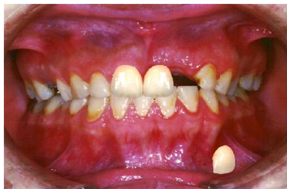
شکل ۸- انتقال دندان انتخاب شده به تصویر بیمار

مرحله ۱۱: مانند مراحل ۵ و ۹، دندان کانین انتخاب شده را Paste نموده و با ابزاری که ذکر شد آن را به فرم و رنگ مورد نظر تبدیل کرده و در جایگاه مناسب قرار می‌دهیم (شکل ۱۲).