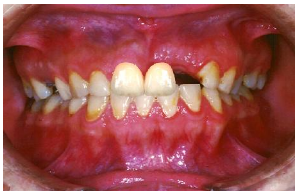
شکل ۶- انتقال دندان سانترال تصحیح شده به تصویر بیمار مرحله ۶: از بانک دندان، دندان لترال را انتخاب نموده و آن را کپی می‌نماییم (شکل ۷).