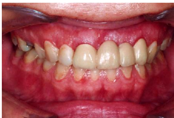
شکل ۱۳- طرح درمان بریج سه واحدی سانترال- سانترال- لترال

مرحله ۹: دندان کانین را از بانک دندانی انتخاب کرده و آن را کپی می‌نماییم (شکل ۱۰).