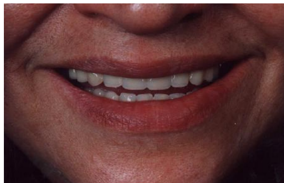
شکل ۱۸- تصویر نهایی بیمار پس درمان

درمان برای ما شد و نهایتاً نمای پس از درمان را می‌بینیم که دنجری با خصوصیتی که بیمار خواهان آن بود و از نظر تکنیکی نیز صحیح بود، برای بیمار ساخته شد (شکل ۱۸). قابل ذکر است که کل فرآیند این کار از نظر زمانی حدود ۲۰-۱۵ دقیقه زمان می‌برد.