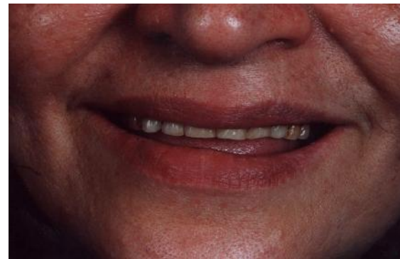
شکل ۱۴- دندان لبخند بیمار با دنچر نامناسب

مرحله ۱: نمای لبخند بیمار با دنچر نامناسب می‌باشد (شکل ۱۴).