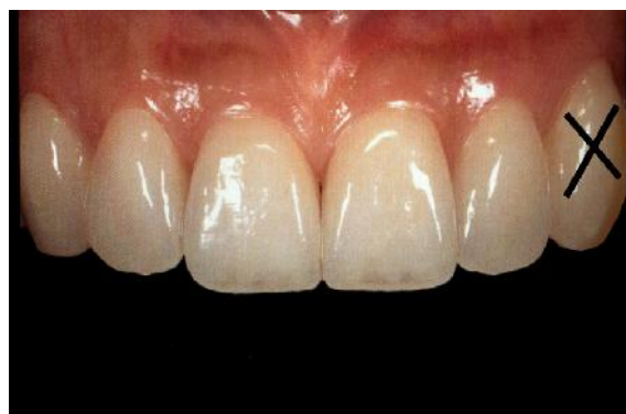
شکل ۱۰- انتخاب دندان کانین از بانک دندانی

باتوجه به این تصاویر برای ما مشخص شد که قرار دادن بریج