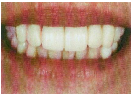
شکل ۱- بانک دندانی (ه)

مجموعه‌ای از پروتزهای زیبای دندان‌های قدامی، پروتزهای کامل زیبا، عکس‌هایی از دندان‌های بیماران با رستوریشن‌های زیبا در یک فولدر با نام بانک جمع‌آوری می‌شود و در ایجاد تغییرات دندانی استفاده می‌شود (شکل ۱).