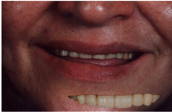
شکل ۱۶- همگون‌سازی دندان‌های انتخاب شده با تصویر بیمار

مرحله ۴: دندان‌ها را در جایگاه مناسب خود قرار دادیم و سپس لب بیمار را از تصویر اولیه با ابزار Select به طور مناسب برش دادیم، کپی کرده و به این تصویر انتقال دادیم، آن را Paste کرده و در جایگاه خود قرار دادیم (شکل ۱۷) و به این صورت مرحله ۵ حاصل شد که