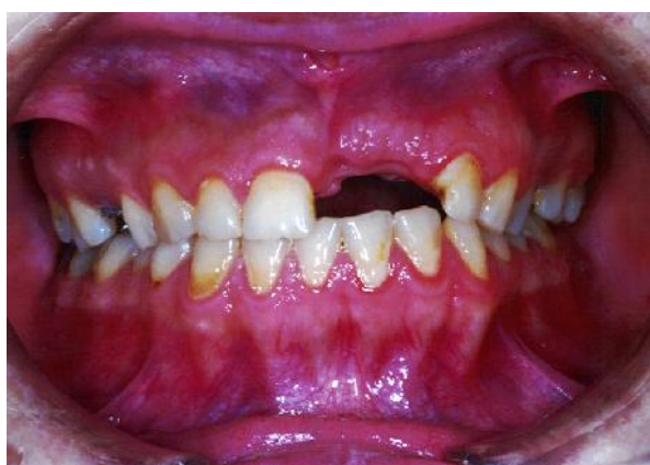
شکل ۲- انتخاب رستوریشن از بانک دندانی

مرحله ۲: دندان سانترال زیبایی را از بانک دندانی انتخاب نموده و آن را کپی نمودیم (شکل ۳).