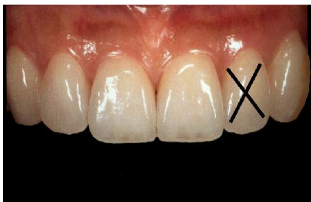
شکل ۷- انتخاب دندان لترال از بانک دندان مرحله ۷: دندان لترال انتخاب شده را روی تصویر بیمار می‌آوریم (شکل ۸).