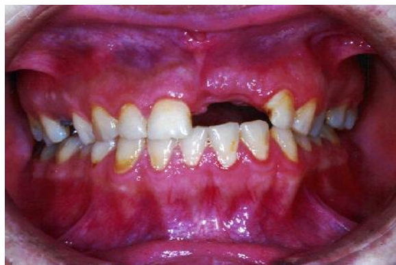
شکل ۵- همگون سازی دندان انتخاب شده با رنگ و اندازه دندان‌های بیمار مرحله ۵: دوباره این دندان سانترال تصحیح شده را کپی نموده آن را Paste کرده و با ابزار موجود آن را چرخانده و کنار دندان سانترال سمت راست قرار می‌دهیم (شکل ۶).