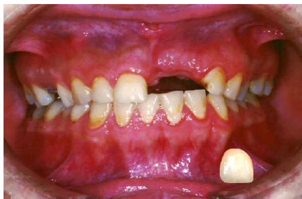
شکل ۴- انتقال دندان انتخاب شده به تصویر بیمار