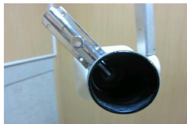
شکل ۳- تصویر کشوی رفت و برگشت نشانگر لیزری