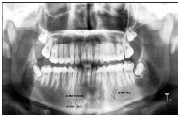
شکل ۱- رادیوگرافی پانورامیک (چپ) و پانورامیک بازسازی شده از CBCT (راست) نشان دهنده محل انشعاب کانال ثنایایی از کانال مندیبولار می باشد.

کانال مندیبولار یکی از ساختارهای آناتومیک نرمال فک تحتانی مرتبط با درمان ایمپلنت است که از سوراخ مندیبولار در راموس به صورت مورب به طرف پایین و قدام آمده و سپس در تنه مندیبل به صورت افقی پیش می رود. عمدتاً مابین ریشه های پرمولر اول و دوم و یا زیر پرمولردوم پایین، این کانال به دو قسمت چانه ای و ثنایایی تقسیم می شود که شاخه چانه ای با یک چرخش به سمت بالا و دیستال به نام حلقه قدامی از محل سوراخ چانه ای در سطح باکال مندیبل خارج می شود و شاخه ثنایایی نیز از داخل کانال ثنایایی زیر ریشه دندان های ثنایای پایین تا محل سوراخ زبانی امتداد می یابد (۱،۲) (شکل ۱).