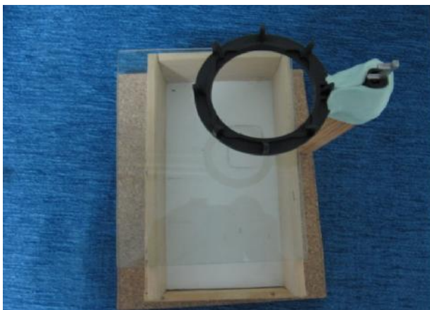
شکل ۱- وسیله چوبی طراحی شده جهت تثبیت موقعیت گیرنده تصویر

گروه ۳: زاویه اشنايدر 30^{\circ} > و رادیوس 7/03 - 4/66