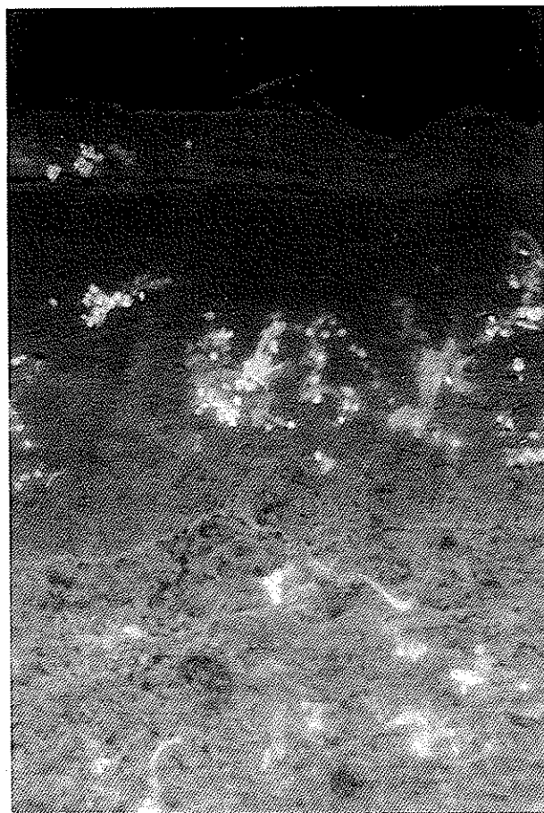
تصویر شماره ۱- رسوب IgM بر روی Colloid Bodies در اپی تلیوم و ناحیه سطحی بافت همبند در نمونه شماره ۴

کدام ۱ مورد در BMZ دیده شد که البته به وضوح الگوی مشاهده شده با فیبرینوژن نبود. رسوب مشاهده شده به صورت نامنظم و قطعه قطعه بود (تصویرهای شماره ۲ و ۳). IgA هرگز در BMZ یافت نشد.