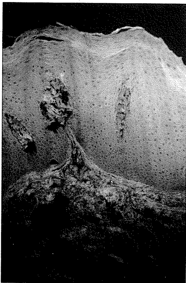
تصویر شماره ۳- رنگ‌آمیزی با آنتی‌فیبروزن در یک الگوی گرانولر و فیبریلار نامنظم در ناحیه غشای پایه در نمونه شماره ۴

رسوبی از پروتئین‌های ایمونوراکتیو دیده نشد؛ در نمونه شماره ۵ نیز که تشخیص Hematoxylline & Eosin (H&E) مورد تردید بود، فقط رسوب گرانولر IgM در دیواره عروق مشاهده شد؛ در نمونه‌های شماره ۸ و ۱۰، فقط رسوب فیبرینوژن در BMZ دیده شد و در نمونه شماره ۶ رسوب فیبرینوژن در BMZ و جدار رگ یافت شد.