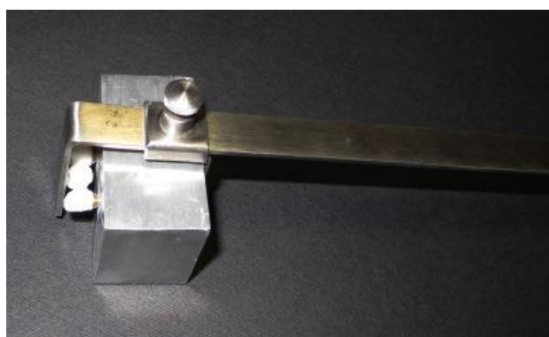
شکل ۳- کلمپ نگه دارنده فریم ورک بر روی مدل اصلی