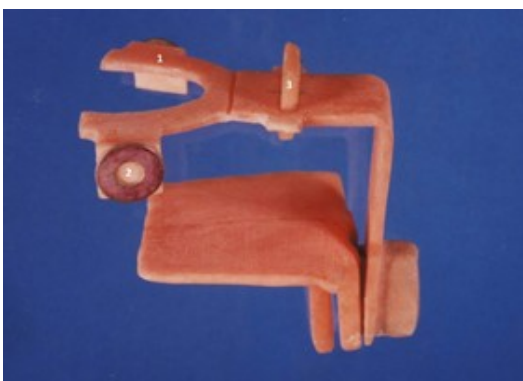
شکل ۲- قسمت متحرک دستگاه HPSI در اتصال با قسمت ثابت. شماره ۱: بایت پلیت، شماره ۲: صفحه حامل حلقه‌های فلزی، شماره ۳: صفحه‌ای مربع شکل حامل چهار سیم فلزی عمود به هم.

۲- دو صفحه عمود بر سطح افق، حامل حلقه‌های فلزی هم اندازه که از نظر موقعیت فضایی در وضعیت کاملاً قرینه‌ای نسبت به mid sagittal plane قرار گرفته بودند (مقایسه قطر دایره ایک نقش بسته روی گرافی، توانایی کنترل میزان بزرگنمایی دو سمت یک کلیشه پانورامیک یا بزرگنمایی در کلیشه‌های مختلف را امکان‌پذیر می‌کرد).