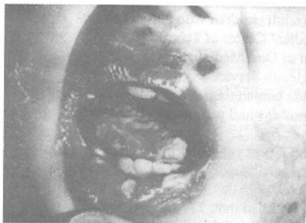
تصویر شماره ۱- برفک ایجادشده در سطح زبان، گونه و گوشه لب و زخمهای متعدد در سطح پوست صورت

قادر به ایجاد عفونت در افراد سالم نیستند. کاندیدیازیس پوستی، مخاطی مزمن در اثر اختلال در دستگاه ایمنی سلولی میزبان به وجود می آید؛ در ضمن کمبود روی و آهن را جزو عوامل مستعدکننده بیماری به حساب آورده‌اند (۱۵،۵).