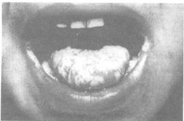
تصویر شماره ۲- برفک ایجادشده به صورت غشای کاذب سفیدرنگ