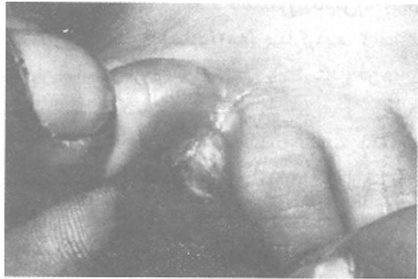
تصویر شماره ۴- ضایعات کاندیدیایی بین انگشتان

از نظر شمارش لئوسیت‌های T در خون محیطی از آزمون روزت (Rosette) استفاده گردید و میزان IgM و IgG در بیماران ارزیابی گردید (جدول شماره ۵).