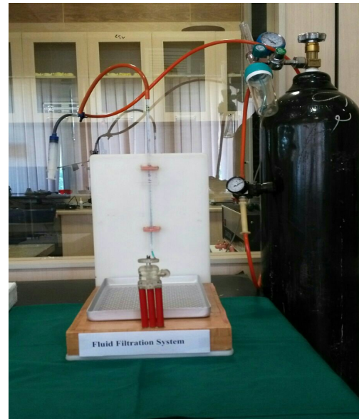
شکل ۱- دستگاه اندازه‌گیری فیلتراسیون مایع

مطالعه دیگری که توسط Borges و همکاران (۲۰) (۲۰۱۰) بر روی خصوصیات فیزیکی و شیمیایی Bio MTA و ProRoot MTA و سمان پورتلند انجام شد نشان داد که تفاوت چشمگیری بین نسبت آب به پودر در دو ماده Bio MTA و ProRoot MTA وجود ندارد و