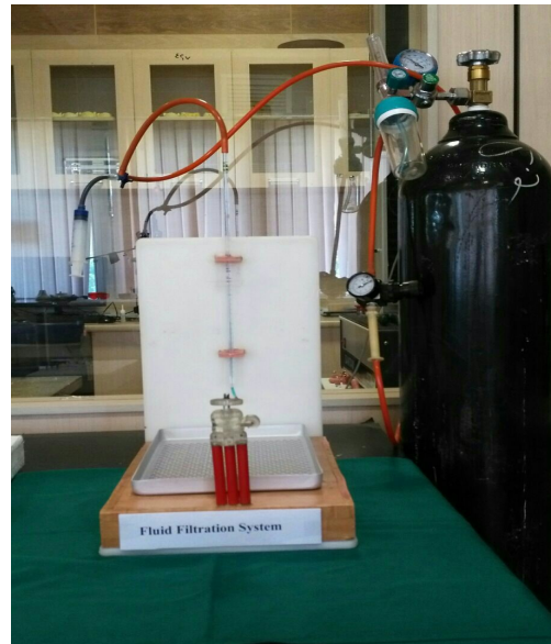
شکل ۱- دستگاه اندازه‌گیری فیلتراسیون مایع

مطالعه دیگری که توسط Borges و همکاران (۲۰) (۲۰۱۰) بر روی خصوصیات فیزیکی و شیمیایی Bio MTA و ProRoot MTA و سمان پورتلند انجام شد نشان داد که تفاوت چشمگیری بین نسبت آب به پودر در دو ماده Bio MTA و ProRoot MTA وجود ندارد و