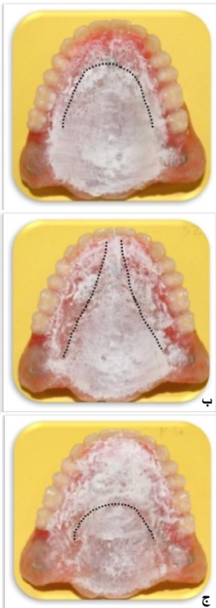
شکل ۴- پالاتوگرافی موقعیت تعیین شده کام سخت با خمیر فشار نما. الف) تلفظ حرف «ت و د»، ب) تلفظ حروف «س و ز»، ج) تلفظ حروف «ک و گ»

اصلاح شد که با تماس مناسب زبان و کام، صداها به شکل واضح و راحت قابل تلفظ باشند (شکل ۴).