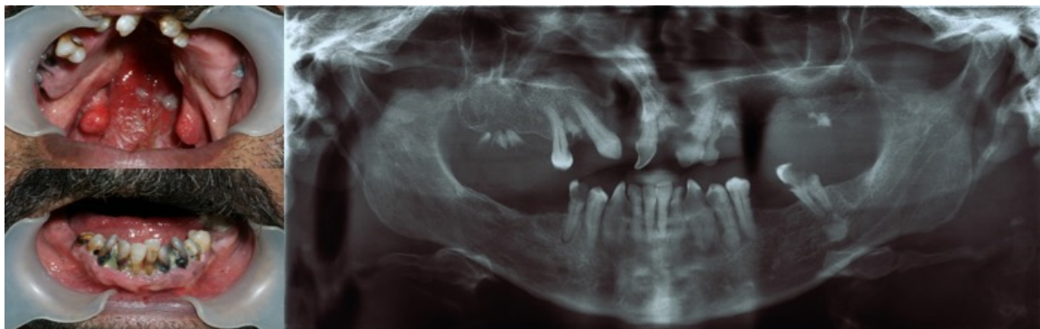
شکل ۱- فوتوگرافی و رادیوگرافی بیمار در مراجعه اولیه و پیش از آغاز درمان

درمان انتخابی در این بیمار پیوند استخوان و استفاده از پروتز متکی بر ایمپلنت بود که با توجه به اندازه ضایعه، سن و خواست بیمار و