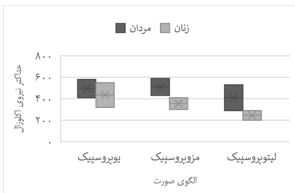
نمودار ۲- حداکثر نیروی اکلوزال و جنس و الگوی صورت

بر طبق آنالیز آماری رابطه معنی‌داری بین حداکثر نیروی اکلوزال و هیچ یک از فرم‌های سه گانه سر وجود نداشت ( P=0/813 ). طبق تست correlation بین الگوی سر و صورت رابطه معنی‌داری وجود نداشت ( P=0/523 ). حداکثر نیروی اکلوزال در مردان همواره بیشتر از زنان بود و این بیشتر بودن در هر یک از الگوهای صورتی نیز برقرار بود. به طور مثال در مردان یوپروسپیک میزان MOF از زنان یوپروسپیک بیشتر بود و این بیشتر بودن در هر یک از فرم‌ها به یک نسبت در مردان از زنان بود به همین دلیل از لحاظ آماری معنی‌دار نبود (نمودار ۲).