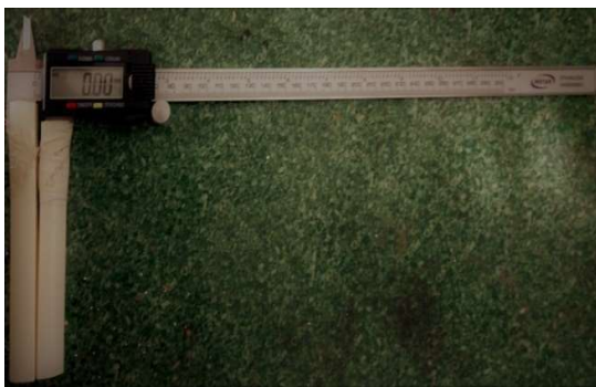
شکل ۲- کولیس مورد استفاده در پژوهش

فاصله بین نقاط Nasion-Gnathion و Nasion-Subnasal و Subnasal- Gnathion و Zygoma-zygoma و Gonial-Gonial و Biparietal و Glabella- Opisthocranion از روی صورت و سر افراد