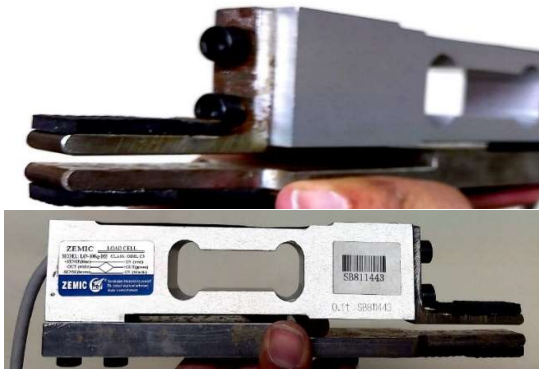
شکل ۱- دستگاه ثبت نیروی بایت

zimec با ظرفیت ۱۰۰ کیلوگرم استفاده شد که توسط دو بازوی فلزی که به آن متصل شده بود، قابلیت گاز گرفته شدن توسط بیمار را پیدا کرده بود. در قسمت بایت لایه‌ای لاستیکی اضافه شد تا بایت روی فلز انجام نشود و راحت‌تر صورت گیرد (شکل ۱). میزان نیروی وارده توسط بیمار در یک نمایشگر و با واحد نیوتن قابل مشاهده بود. ابتدا روکش یکبار مصرف روی سر وسیله قرار داده شد. سپس سر سنسور روی سطح دندان مولر اول مندیبل/ماکزایلا قرار داده شد (۱۱، ۱۰، ۴) و از افراد خواسته شد تا در حالی که سر آن‌ها به جایی تکیه ندارد با حداکثر نیروی ممکن سر سنسور را به مدت ۲ تا ۳ ثانیه گاز بگیرند. سپس به مدت ۲۰ ثانیه استراحت کنند. این عمل ۲ بار دیگر تکرار شد. حداکثر مقدار اندازه‌گیری شده مبنای محاسبه قرار گرفت. اندازه‌گیری معیارهای صورتی به وسیله دو کولیس دیجیتال انجام شد که به یکی از آن‌ها برای اندازه‌گیری راحت‌تر ابعاد، سر بازویی اضافه شد (شکل ۲).