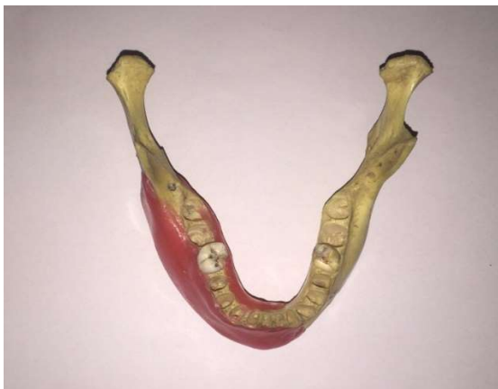
شکل ۱- تصویر مندیبل و دو لایه موم برای بازسازی تنه مندیبل

معیارهای ورود در این مطالعه شامل دندان تک ریشه انسانی کشیده شده سالم با پرکردگی گوتا پرکا در دسترس و بدون شکستگی ریشه بودند. انتخاب نمونه‌ها، بدون توجه به سن، جنس و دلیل Extraction صورت گرفت. تمامی نمونه‌ها برای تهیه تصاویر CBCT و رادیوگرافی PA دیجیتال توسط فردی که جز مشاهده‌گران نبود از شماره ۱ تا ۶۰ به صورت تصادفی کدگذاری شد و هیچ یک از مشاهده‌گران از ترتیب کدگذاری اطلاعی نداشتند. سپس در ریشه نیمی از نمونه‌ها شامل ۳۰ دندان، به صورت تصادفی با استفاده از چیزل و چکش شکستگی باکولینگوالی ایجاد شد که در ادامه با چسب دو قطعه شکسته شده بهم متصل گردید. برای تهیه تصاویر، هر دندان در محل خود بر روی جایگاه خود در مندیبل انسانی قرار گرفت. مزیت استفاده از مندیبل انسانی برای تهیه تصاویر این است که به دلیل سوپرایمپوز شدن استخوان بر روی ریشه دندان تصاویر به دست آمده طبیعی‌تر و مشابه مدل انسانی است. برای بازسازی بافت نرم روی تنه مندیبل از ۲ لایه موم استفاده گردید (شکل ۱).