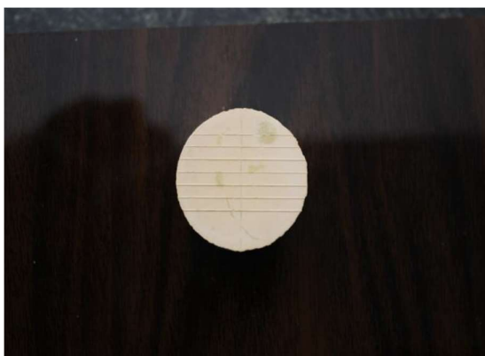
شکل ۲- نمونه گچی زیر دوربین از فاصله ۱۵ سانتی متری

برای اندازه‌گیری میزان ثبت جزئیات شیار ۵۰ میکرومتری با میکروسکوپ نوری با بزرگنمایی ۱۲ برابر مشاهده شده و هر نمونه در یکی از گروه‌های زیر قرار گرفت: