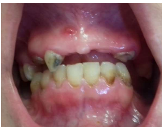
شکل ۱- سینوس ترکت در ناحیه قدامی ماگزایلا

بیمار خانم ۳۱ ساله به بخش اندودنتیکس دانشکده دندانپزشکی دانشگاه علوم پزشکی تهران با شکایت اصلی درد شدید در دندان پره مولر دوم ماگزایلا مراجعه کرد. او هیچ مشکل سیستمیکی نداشت و کاملاً سالم بود. در پرونده درمانی دندانپزشکی بیمار، تاریخچه‌ای از ترمیم تاجی و پرکردگی برخی دندان‌ها وجود داشت. معاینات داخل دهانی نشان داد که بافت پریودنتال بیمار طبیعی بود، اما بهداشت دهان وی نامناسب بود و دندان‌های زیادی پوسیدگی داشتند و حساسیت به دق در دندان ۱۵ وجود داشت و در مخاط ناحیه پری اپیکال دندان ۱۲ (بدون پوسیدگی و ترمیم تاجی) سینوس ترکت وجود داشت (شکل ۱). معاینات رادیوگرافی پوسیدگی اکلوزالی دندان ۱۵ را نشان داد که نزدیک پالپ چمبر دندان بود. یک رادیوگرافی به منظور ردیابی سینوس ترکت در ناحیه قدامی تهیه شد. تشخیص برای دندان ۱۵ پالپیت غیر قابل برگشت بود اما هیچ پوسیدگی در دندان ۱۲ مشاهده نشد.