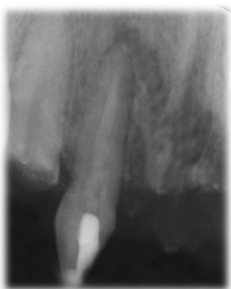
شکل ۳- قرار دادن کلسیم هیدروکساید در لترال راست ماگزایلا

یک هفته بعد، بیمار در مراجعه بعدی (یک هفته بعد) سینوس ترکت بیمار بهبود یافته بود (شکل ۴).