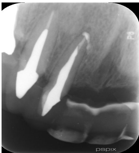
شکل ۸- فالوآپ ۱۲ ماهه

داروی داخل کانال خارج شد و کانال‌ها با ۵ میلی لیتر ۱۷٪ EDTA (Morvabon, Iran) به مدت ۱ دقیقه و سپس ۵ میلی لیتر ۲.۵٪ NaOCl به مدت ۱ دقیقه برای برداشت اسمیرلیبر شستشو داده شد. سپس کانال‌های ریشه با کن‌های کاغذی استریل خشک شد و کانال‌ها با گوتاپرکا و سیلر Endoseal MTA پر شدند. تیپ پلاستیکی تا رسیدن به طول وارد کانال شد و سپس سیلر به درون کانال تزریق شد و یک کن اصلی (master cone) (۶٪، #۴۰) آغشته با Endoseal MTA داخل کانال تا طول کارکرد قرار داده شد و کانال به روش single cone پر شد. پس از پر کردن کانال گوتاپرکای اضافی به کمک وسایل داغ دستی خارج شد. در انتها پالپ چمبر با الکل اتیلیک ۷۰٪ تمیز و دندان با ماده ترمیم موقت پر شد. رادیوگرافی پس از پرکردگی کانال ریشه دندان، پر شدن کامل سیستم کانال ریشه را نشان داد، اما میزان کمی اکستروژن Endoseal MTA در سطح جانبی ریشه وجود داشت (شکل ۵).