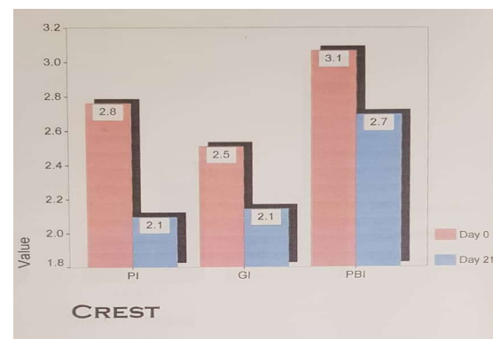
نمودار ۲- نمودار مقایسه ایندکس‌های پلاک، لثه‌ای و خونریزی از لثه قبل و بعد از درمان در گروه کنترل