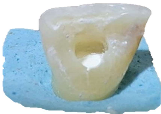
شکل ۱- قرار گرفتن مواد درون حفره دسترسی با ضخامت ۳ میلی متری

اندازه‌گیری و استاندارد سازی با استفاده از پروب) درون حفره دسترسی قرار گرفت (شکل ۱). نمونه‌ها در محیط خشک و بدون تابش مستقیم آفتاب نگهداری شدند. پس از اطمینان از سفت شدن سرامیک سرد و MTA Angelus به مدت ۲۴ ساعت، حفره‌های دسترسی توسط رزین مودیفاید گلس آینومر (FujiII, LC, GC, Japan) ترمیم شدند (شکل ۲). سپس نمونه‌ها به صورت جداگانه درون لوله‌های حاوی بزاق مصنوعی قرار داده شده و در همان شرایط محیطی (در محلول بزاق مصنوعی به دور از تابش مستقیم آفتاب) نگهداری شدند. این محلول هر دو هفته یک بار تعویض گردید. برای باقی ماندن بیوسرامیک‌ها در حفره دسترسی و جلوگیری از داخل شدن آن‌ها به داخل کانال از مقدار کمی گلس استفاده شد.