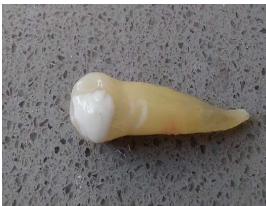
شکل ۲- ترمیم حفره دسترسی توسط رزین مودیفاید گلس آینومر

هیپوکلوریت سدیم برر سی شد. تعداد نمونه‌ها با در نظر گرفتن سطح اطمینان ۹۵٪ و توان ۸۰٪ و همچنین انحراف معیار ۱/۶۴ برای نمره تطابق لبه‌ای و در نظر گرفتن اختلاف ۲ واحدی میانگین بین دو گروه MTA Angelus و سرامیک سرد، با استفاده از فرمول زیر برای هر گروه ۱۰ عدد برآورد شد.