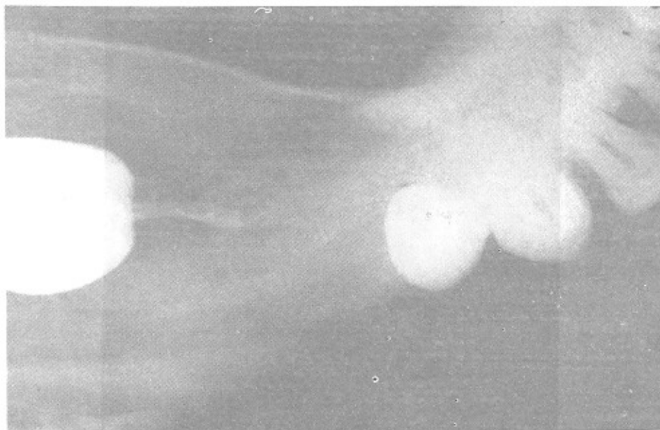
شکل ۳- رادیوگرافی اکلوژال توسعه با کو لیتگوالی ضایعه را نشان می دهد.

سلولهای دوکی شکل با هسته موج دیده می شود که دارای طرح فاسپیکولر و گاهاً گردبادی می باشند. سلولهای فوق در استرومایی فیبروتیک قرار گرفته اند. در قسمتهایی در حاشیه نسج فوق، استروما تغییرات میگزوماتو نشان می دهد علائم بدخیمی دیده نشد (شکل ۴).