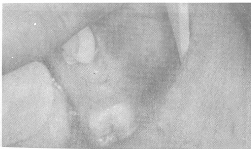
شکل ۲- Expansion باکالی ضایعه را نشان می دهد