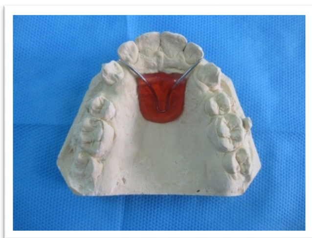
شکل ۱- پلاک رفرنس

کست‌های تهیه شده در ابتدای Retraction و ۴ و ۸ هفته بعد، تریم شدند و پاپیلای انسیزیو و رافه میانی کام بر روی آنها مشخص گردید. بر روی کست اولیه هر بیمار پلاک آکریلی در ناحیه روگا به نحوی ساخته شد که فقط قسمت مرکزی روگای پالاتال را بپوشاند و سیم‌های رفرنس بر روی کست با سیم ۰/۹ میلی‌متر داخل پلاک آکریلی قرار گرفتند (شکل ۱).