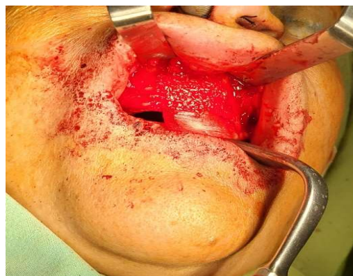
شکل ۳- غشاء و گرفت قرار داده شده‌اند. به بخش آویزان غشاء توجه کنید که در مرحله بعدی به کمک میکروواسکروها به دیواره استخوانی سالم اطراف فیکس می‌شود.

جلسه فالو آپ یک هفته پس از جراحی، بهبود موفقیت آمیزی را نشان داد. بخیه‌ها کشیده شدند و هیچ دهی سنسی دیده نشد. دو ماه بعد از جراحی، قوام سخت و استخوانی با لمس احساس شد. بیمار برای ساخت دنچر کامل به متخصص پروتز ارجاع داده شد.