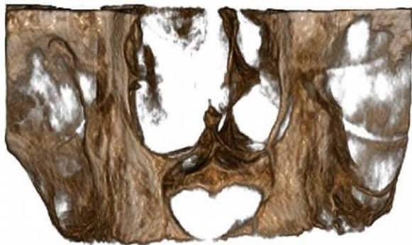
شکل ۲- نمای قلبی شکل در تصویر سه بعدی بازسازی شده

معاینات داخل دهانی، ظاهر نرمال مخاط لبیال مگزیلا را نشان داد و استیوپل محو شده بود اما قوام آن سفت نبود. تورم، موج بود و به صورت تقریبی، با ابعاد ۲۵ میلی متر عرض و ۱۵ میلی متر طول در خط وسط و استیوپل لبیال مگزیلا قرار داشت. در ارزیابی اگزالی، کرونالی و مقطعی مقطع نگاری رایانه‌ای (CBCT)، یک ضایعه موضعی در ناحیه قدامی مگزیلای کاملاً بی‌دندان با ابعاد قدامی خلفی ۱۴/۵ میلی متر، عمودی ۱۵ میلی متر و مدیولترالی ۱۸ میلی متر مشاهده شد. ضایعه حدود کورتیکه مشخص و ساختار داخلی کاملاً رادیولوسنت داشت. در تصویر سه بعدی بازسازی شده، سوپرایمپوزیشن خار قدامی بینی بر روی کیست، شکل قلب را ایجاد کرد (شکل ۲). اکسپنشن قسمت قدامی ریج آلوتولار مگزیلا در نتیجه رشد ضایعه قابل مشاهده بود. صفحه کورتیکالی باکال در بسیاری از مقاطع دیده نشد و صفحه کورتیکالی لینگوال نازک شده بود و در برخی مقاطع دیده نشد. کف حفره بینی نازک شده بود و به موقعیت بالاتری جابه جا شده بود. تورم بافت نرم ناحیه قدامی مگزیلا مشاهده شد.