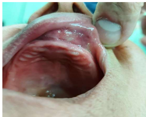
شکل ۱- نمای بالینی، یک تورم با ظاهر نرمال مخاط را در مخاط لبیال مگزیلا نشان می‌دهد که وستیبول را محو کرده است.

خانمی ۶۰ ساله با بی‌دندانی کامل، با شکایت اصلی تورم در ناحیه قدام مگزیلا (شکل ۱) که با نشست دنجر تداخل داشت و برای حدود ۲ یا ۳ سال درد داشت، به دانشکده دندانپزشکی ارجاع داده شد. یک سال پیش، (با تشخیص نادرست اپولیس) درمان لیزر ابلیشن با لیزر ۹۴۰ نانومتر به صورت درمان یک جلسه ای پرتوان با توان تابشی ۳ وات برای ایشان انجام شده بوده است اما تورم مجدداً پس از حدود ۱۰ ماه پدیدار شده بود.