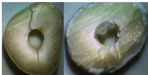
شکل ۲- الگوی شکست کوهزیو (سمت راست)، نمونه خارج شده از آزمایش (سمت چپ)