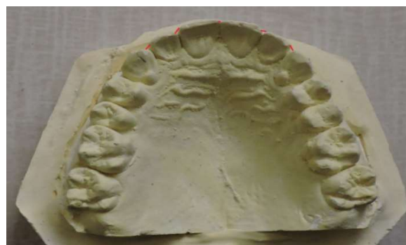
تصویر ۲- محل‌های مورد نظر برای محاسبه شاخص بی نظمی

به منظور ارزیابی پایایی و توافق درون‌مشاهده‌گر، دو هفته پس از پایان دوره پیگیری ۹ ماهه (T3) از ۱۵ بیمار به صورت تصادفی مجدداً قالب گیری انجام شد. کست‌های تهیه شده بار دیگر توسط پژوهشگر اصلی مورد اندازه گیری قرار گرفت و تمامی متغیرهای مورد مطالعه شامل اورجت، اوربایت، طول قوس، عرض بین کانی، عرض بین مولری و شاخص بی نظمی مجدداً ثبت شدند. به منظور تعیین میزان خطای اندازه گیری و بررسی توافق مشاهده‌گر، ضریب همبستگی درون‌طبقه‌ای (Intraclass Correlation Coefficient; ICC) محاسبه شد که مقدار آن بیش از ۰/۹۶۰ به دست آمد و بیانگر پایایی بسیار مطلوب اندازه گیری‌ها بود.