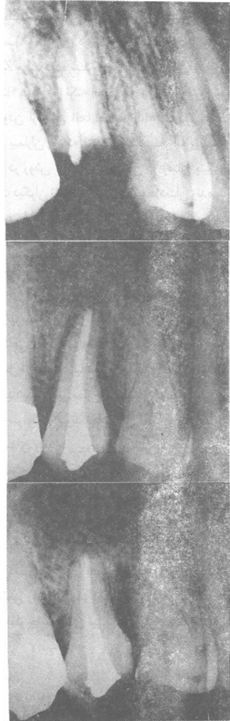
تصویر ۱- زن ۴۵ ساله خانه‌دار، ریشه دندان ۵، با پیوند دندان ۴ جایگزین شده است الف) قبل از عمل ب) بعد از عمل ج) ۶ ماه بعد از عمل