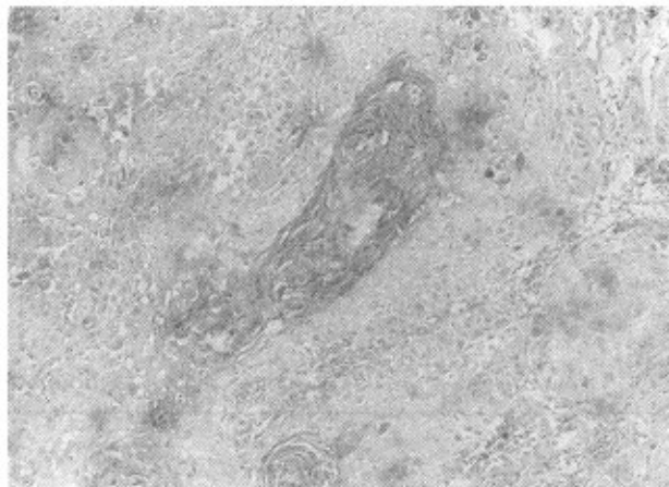
تصویر میکروسکوپی Squamous cell carcinoma