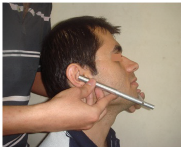
شکل ۴- اندازه‌گیری آنتروپومتریکی طول مؤثر مندیبل