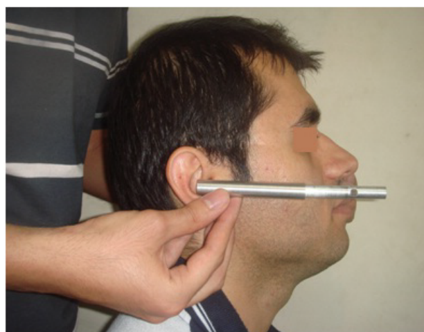
شکل ۳- اندازه‌گیری آنتروپومتریکی طول مؤثر ماگزایلا

در مرحله بعد اقدام به اندازه‌گیری فواصل خطی بر روی بافت نرم انجام شد. برای انجام این روش خط کش مخصوصی (شکل ۲) جهت اندازه‌گیری شاخص‌های آنتروپومتریکی روی پروفایل بیماران طراحی و ساخته شد. این خط کش اساساً از یک قسمت مخروطی جهت قرار گرفتن در مجرای گوش خارجی، یک قسمت مدرج جانبی متحرک برای اندازه‌گیری فاصله و یک میله قدامی که با بافت نرم صورت بیمار در این نقاط تماس می‌یابد، تشکیل شده است. اندازه‌گیری در حالی انجام شد که قسمت مدرج وسیله موازی پلن مید ساژیتال و میله قدامی آن موازی خط اتصال دهنده دو مردمک چشم قرار گیرد. اندازه‌گیری با جابجایی بافتی انجام می‌شد، بدین مفهوم که بافت نرم توسط خط کش تحت فشار ملایم قرار می‌گرفت تا جاییکه مقاومت از سوی بافت سخت زیرین توسط عملگر احساس شود.