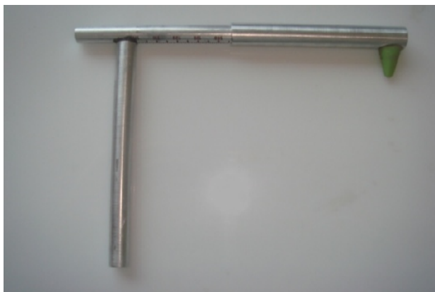
شکل ۲- خط کش مورد استفاده در مطالعه

فکی اورجت است. Zupancic و همکاران با بهره‌گیری از میزان اورجت بیمار تلاش نمودند که روابط فکی زیرین را پیش بینی نمایند، که همبستگی خوبی میان میزان اورجت و رابطه فکی در بیماران کلاس یک، کلاس دو Division 1 و کلاس سه مشاهده شد (۸). با این وجود اورجت قادر به تشخیص روابط اسکلتال کلاس دو Division 2 نبود، که یکی از محدودیتهای این روش به شمار می‌رود. Farkas و همکاران نیز که از پیشگامان آنترپومتری بودند، ارتباط میان اندازه‌گیری‌های آنترپومتریک و سفالومتریک را عمدتاً در بعد عمودی بررسی نموده‌اند (۹،۱۰) و در میان کارهای منتشر شده وی هیچ منبعی که روابط قدامی خلفی را بررسی نموده باشد یافت نشده است. آنچه که در مطالعات وی در بعد عمودی قابل مشاهده می‌باشد، بهره‌گیری و مقایسه از اندازه‌گیری‌های خطی سفالومتریک و آنترپومتریک است. یکی از آنالیزهای سفالومتری که از اندازه‌گیری‌های خطی در بعد قدامی خلفی بهره می‌برد، آنالیز مک نامارا می‌باشد (۱۱). در این آنالیز طول ماگزایلا و مندیبل از محل کندیل سنجیده می‌شود که با توجه به فاصله نسبتاً ثابت مجرای خارجی گوش تا کندیل، شاید بتوان از این لندمارک آنترپومتریک برای اندازه‌گیری‌های خطی مشابه بر روی بافت نرم بهره جست. در صورت برقراری همبستگی مطلوب بین اندازه‌گیری‌های قدامی خلفی آنترپومتریک و سفالومتریک می‌توان به پیش بینی روابط اسکلتال از روی بافت نرم امیدوار بود. هدف از این مطالعه نیز مقایسه اندازه‌گیری‌های به دست آمده از اختلاف واحد آنالیز مک نامارا (Unit Difference in McNamara Analysis) با معادل‌های پیشنهادی روی بافت نرم می‌باشد.