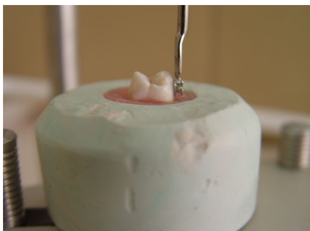
شکل ۱- استفاده از سورویور به منظور قرار دادن صحیح براکت