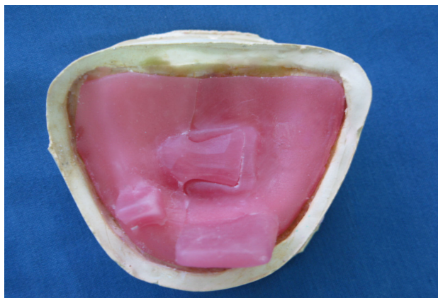
شکل ۳- تری VLC

۸- از آنجایی که در مرحله قبل ثبات قالب ایده‌آل نبود؛ بنابراین جهت دقت بیشتر یک تری VLC دیگر به نحوی طراحی و ساخته شد که قطعات راست و چپ به وسیله یک ناحیه قفل شونده به هم متصل شوند و قسمت کوچک‌تر در سمت چپ که دارای وستیبول عمیق تری بود طراحی شد (شکل ۳).