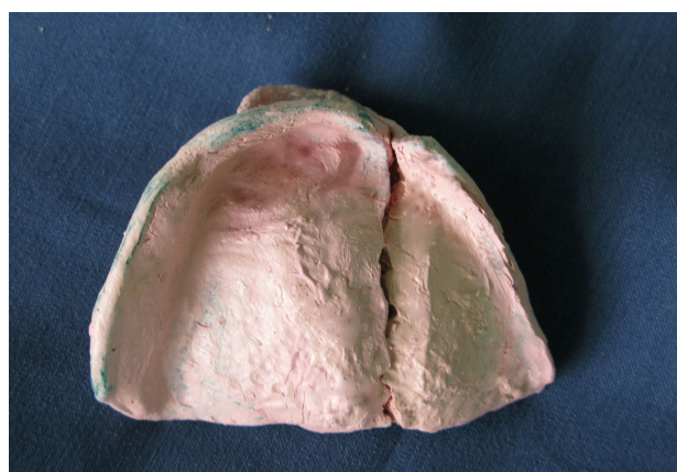
شکل ۲- کست با گچ دندانپزشکی

۷- بوردرها تنظیم شده و قالب به وسیله خمیر زینک اکساید ازنول (Kerr Italia, Ealerno, Italy) وقتی که دو قسمت در دهان به هم متصل شده بودند گرفته شد. زمانی که ماده Set شد، قالب به صورت ۲ قسمت جدا از هم از دهان خارج شده و اضافات از لبه‌های تری به وسیله تیغ بیستوری برداشته شد، سپس دو قسمت به هم متصل گشت و کست با گچ دندانپزشکی ریخته شد (شکل ۲).