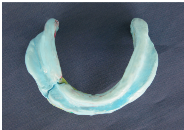
شکل ۴- اتصال دو قسمت قالب

گردید (شکل ۴) و کست به وسیله گچ دندانپزشکی ریخته شد. از آنجایی که بیس به دست آمده حجم کوچک‌تری از تری داشت، با مانور خاصی امکان داخل بردن بیس در دهان به صورت یک تکه حاصل شد و در نهایت مراحل ساخت دنچر به صورت معمول انجام گردید. از آرایش مونوپلن جهت چین دندان‌ها استفاده شد، دنچر تحویل داده شد و جلسات پیگیری حمایت و تنظیم صورت گرفت و پس از ۲ سال پیگیری بیمار از دنچر انجام گردید.