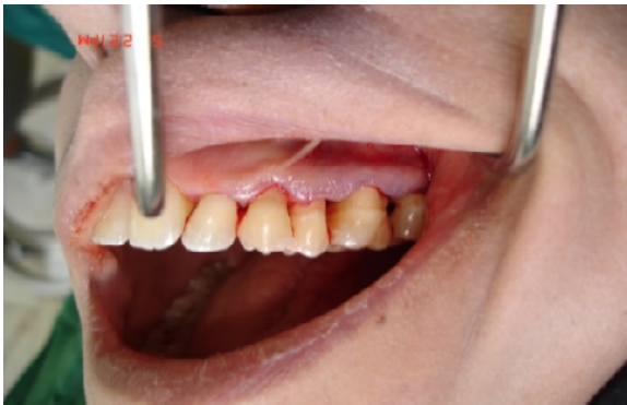
شکل ۲ - مراحل جراحی الف) برش سالکولار در سمت باکال