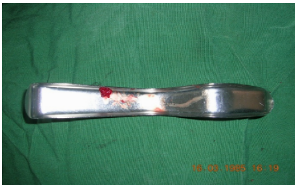
د- استفاده از A.B.G در سمت کنترل