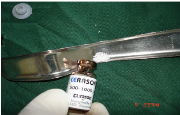
ج- استفاده از Cerasorb در سمت تست