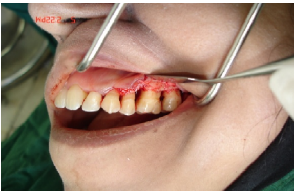
ب) بلند کردن فلپ موکوپریوستال