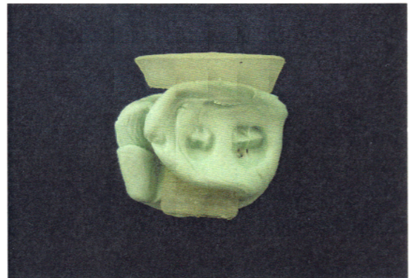
شکل ۱- تهیه رادیوگرافی RVG الف) Template تهیه شده از ماده قالب‌گیری