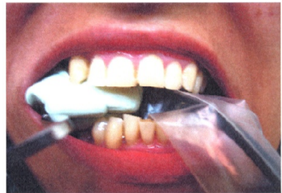
ج) Sensor و Template با XCP در دهان بیمار

در ضایعات گروه کنترل در این مرحله به جای Cerasorb از Autogenous Bone Graft استفاده شد، به این ترتیب که پس از تمیز کردن ضایعه و آماده‌سازی محل، جراحی اضافه برای برداشتن Autogenous Bone در ناحیه توبروزیته یا رترومولر انجام گرفت و استخوان به صورت مخلوط اسفنجی و کورتیکال تهیه گردید (شکل ۲).