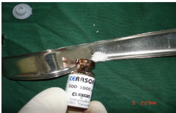
ج- استفاده از Cerasorb در سمت تست