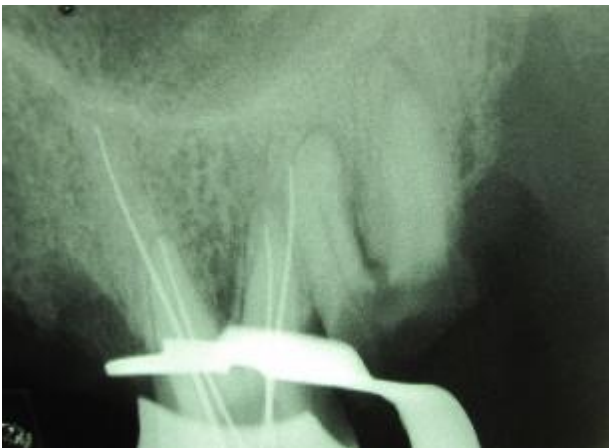
شکل 2- رادیوگرافی طول کارکرد، چهار کانال جداگانه را نشان داد.

مدخل بسیار کوچک دیستوباکال به وسیله اکسپلورر اندودنتیک یافت گردید. در محدوده پالاتال کف اتاقک پالپ، اوریفیسی مشاهده شد که نسبت به موارد معمول، موقعیت آن بسیار دیستوپالاتال بود. با توجه به رادیوگرافی اولیه، با احتمال وجود کانال چهارم، حفره دسترسی به سمت مزیوپالاتال گسترش داده شد و کانال چهارم یافت گردید. مدخل‌های پالاتال به نسبت مدخل‌های باکال در وضعیت کاملاً قرینه ای قرار داشتند. رادیوگرافی اندازه‌گیری تصویر چهار ریشه جداگانه را نشان می‌داد (شکل 2).