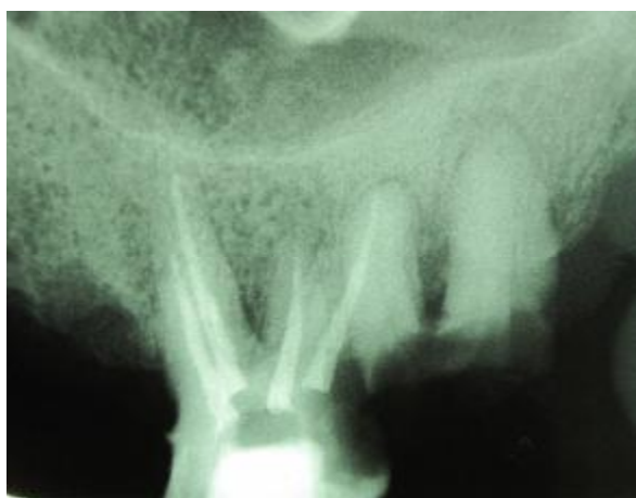
شکل 3- ب) اشعه مرکزی از سمت مزایال تابانده شد.