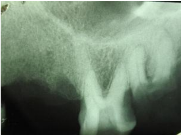
شکل 1- رادیوگرافی پیش از درمان، رادیولونسیس پری اپیکال را نشان نداد.

کامل برخوردار بود. در ارزیابی اولیه رادیوگرافیک، تصویر دندان مورد نظر با آناتومی موارد متعارف همخوانی نداشت (شکل 1).