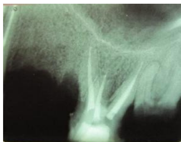
شکل 3- الف) دو ریشه جداگانه پالاتال و کانالها