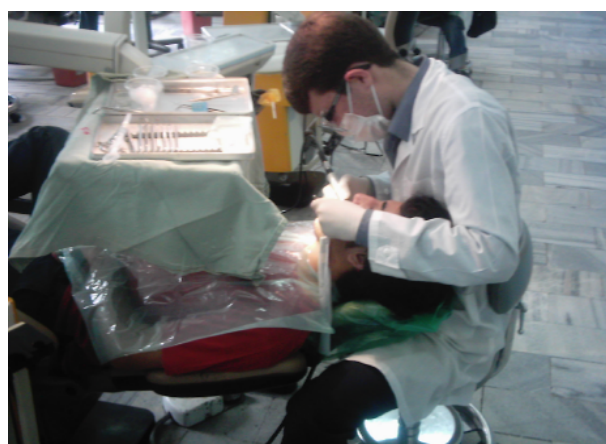
شکل ۴- نمونه‌ای از وضعیت بدن دانشجویان در حین انجام کار به وضعیت گردن که از حالت طبیعی خارج شده توجه کنید.

این روش در یک مشاهده کوتاه مدت می‌تواند پوسترچر افراد را ارزیابی کند. در این روش قسمت‌های مختلف بدن برای آنالیز در دو گروه A و B قرار می‌گیرند. در گروه A پوسترچر تنه، گردن و پاها قرار می‌گیرند. مقدار بار و نیرو نیز ثبت می‌شود. در گروه B بازوها، ساعد و نحوه اتصال دست با وسیله قرار دارند. این اطلاعات توسط روش مشاهده مستقیم به دست می‌آید. زمان مشاهده برای هر پوسترچر کاری ۳۰ دقیقه می‌باشد. برای ارزیابی دقیق‌تر از هر پوسترچر کاری یک یا چند عکس تهیه می‌شود (شکل ۴). پس از بررسی پوسترچر افراد، نمره نهایی REBA به دست می‌آید که عددی بین ۱ تا ۱۵ برای هر سمت بدن می‌باشد. بر اساس این نمره پوزیشن فرد به ۵ رتبه تقسیم می‌شود که بر اساس آن سطح خطر و میزان نیاز به اصلاح پوزیشن فرد تعیین می‌شود. به طور مثال اگر پوزیشن فرد به گونه‌ای باشد که نمره آن ۱۲ باشد، این فرد در سطح خطر بالایی از لحاظ ابتلا به بیماری‌های اسکلتی عضلانی قرار دارد و نیاز فوری به اصلاح وضعیت بدن خود در حین کار دارد.