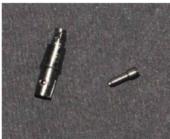
شکل ۴- شکست پیچ اباتمنت در گروه تیتانیومی پیش ساخته