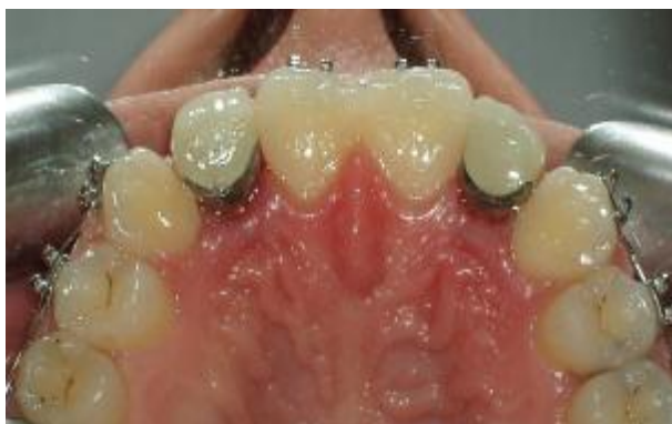
شکل ۱۳- رستوریشن های نهایی در محل