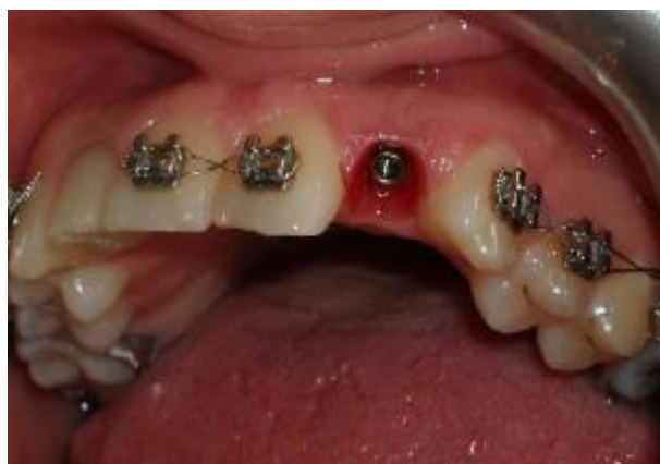
شکل ۱۲- کانتور مناسب نسج نرم پس از باز کردن رستوریشن های موقتی

در این مورد سعی شد با ساختن رستوریشن های موقتی (۱)، کانتور نسج نرم به روش غیر جراحی اصلاح شود. ایده آل ساخت رستوریشن موقتی با Titanium Temporary Abutments و کامپوزیت های لابراتواری با استحکام بالاتر بود که به علت عدم موافقت بیمار مقدور نشد که مشکلاتی از جمله استحکام کمتر را موجب می شود. به نظر می آید شکل دهی بافت نرم به وسیله رستوریشن موقتی به برقراری مجدد کانتورهای طبیعی لثه و پایی بین دندانی اطراف یک رستوریشن متکی بر ایمپلنت در قدام ماگزایلا، کمک شایانی می نماید.