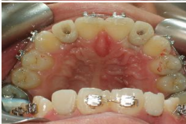
شکل ۱۱- وضعیت نسج نرم پس از سپری شدن ۲ هفته

بعد از برداشتن کامپوزیت سوراخ‌های پیچ رستوریشن‌های موقتی و بازکردن آنها، با توجه به شکل گرفتن مناسب بافت نرم (شکل ۱۲)، اباتمنت‌های 3inOne تراش خورده به راحتی روی فیکسچرها بسته شد و رستوریشن‌های نهایی، به آسانی قرار داده شدند و پس از تنظیم‌های لازم رستوریشن‌ها، گلیز و با سمان موقت