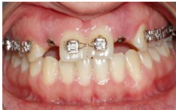
شکل ۵- وضعیت نسج نرم در زمان قالب گیری