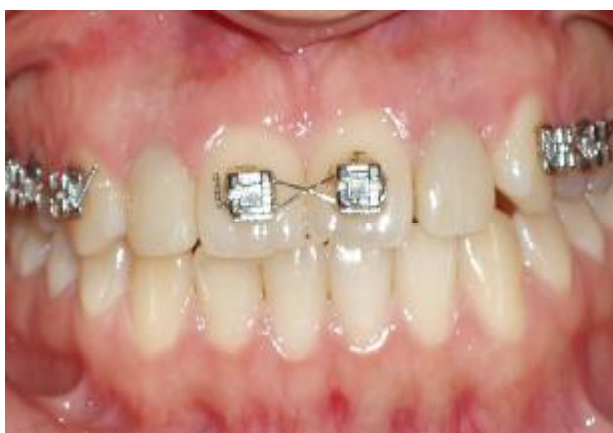
شکل ۱۱- وضعیت نسج نرم پس از سپری شدن ۲ هفته

بعد از گذشت یک هفته از بستن Healing اباتمنت‌های Flared، بیمار فرا خوانده شد و اباتمنت‌ها باز شدند. لثه تا حدودی Recontour شده بود. رستوریشن‌های کامپوزیتی در دهان تنظیم شدند، کانتور مناسب در ناحیه لثه ایجاد شد و بعد از ارزیابی تماس‌های پروگزیمال و اکلوزال، سطح کامپوزیتی رستوریشن‌های موقتی پالیش و رستوریشن‌ها با ۳۰ N torque پیچ شدند و سوراخ پیچ که در ایمپلنت سمت راست در لبه انسیزال و در سمت چپ پالاتالی بود با همان کامپوزیت لایت کیور سیل شد (شکل ۱۰). پس از گذشت دو هفته با توجه به ایجاد کانتور مناسب لثه و پاپی‌های بین‌دندانی (شکل ۱۱)، ابتدا یک قالب آلژیناتی از فک بالا با حضور رستوریشن‌های موقتی تهیه و سپس قالب‌گیری غیرمستقیم مجدد از فیکسچرها و کانتور جدید لثه با استفاده از رستوریشن‌های موقتی در نقش کوپینگ‌های قالب‌گیری انجام شد، کست نهایی بلافاصله ریخته شد و رستوریشن‌ها به دهان بیمار منتقل گردید. در لابراتوار با کمک ایندکس سیلیکونی ساخته شده روی کست