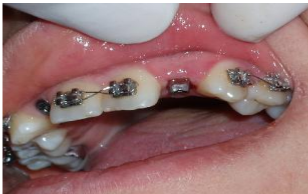
شکل ۷- اباتمنت تراش خورده متصل به ایمپلنت

از این رو دو عدد Healing abutment از نوع Flared emergence profile، ۳/۵×۴/۵ میلی متر جایگزین Healing abutment های قبلی شدند.