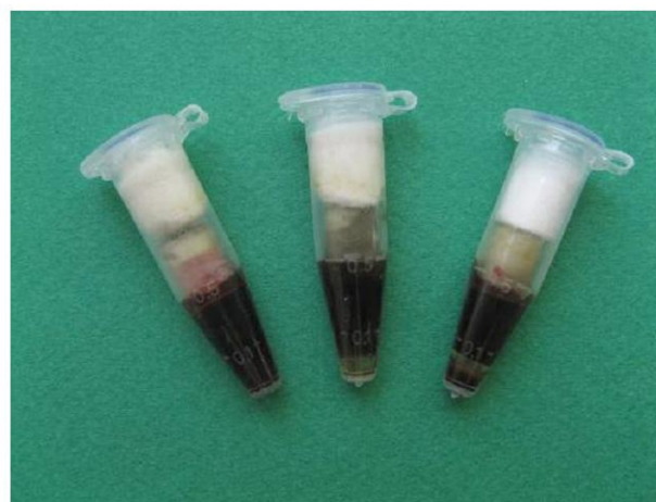
شکل ۳- قرار گیری سطح نمونه‌ها در تماس با خون

نحوه آماده‌سازی گروه‌های ۵ و ۶ مانند گروه‌های ۳ و ۴ بود با این تفاوت که مواد مورد مطالعه به جای مخلوط شدن با مایع پیشنهادی کارخانه با خون مخلوط شدند. با توجه به اینکه استاندارد در مورد مخلوط کردن این مواد با خون وجود ندارد و اینکه وزن مخصوص خون افراد مختلف متفاوت خواهد بود، تصمیم بر این شد که از حجم