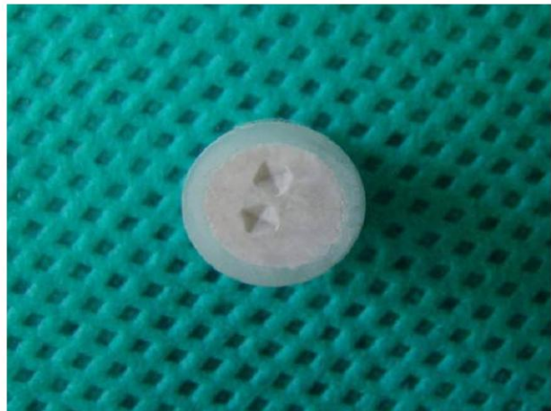
شکل ۴- اثر سنجه فرورونده (Indenter) بر سطح ماده

می‌کرد که موجب ایجاد یک فرورفتگی در سطح آن می‌شد (شکل ۴).