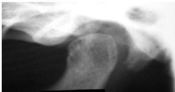
شکل ۱- تصویر ناحیه TMJ در رادیوگرافی پانورامیک با ضایعه (تصویر بالا) و بدون ضایعه (تصویر پایین)