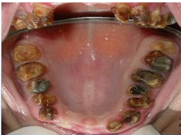
شکل ۳- آملوژنیزس ایمپرکتا نوع Hypocalcified

سایش شدید و سریع مینا بلافاصله پس از رویش دندان، حساسیت نسبت به تغییرات حرارتی، رنگ قهوه‌ای تیره در مینا، وجود ترکیبات آهکی نظیر انواع جرم و Calculus در اطراف دندان به دلیل حساسیت شدید بیمار و عدم رعایت بهداشت فردی و عدم تمایز مینا و عاج در رادیوگرافی با حداقل درصد تراکم مینایی (شکل ۳).