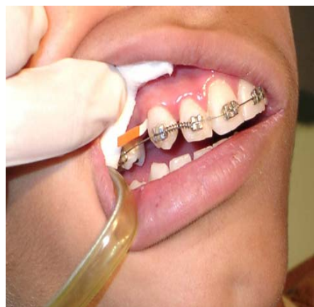
شکل 1- نحوه جمع‌آوری مایع شیار لثه‌ای

میانگین و انحراف معیار غلظت IL-6 در دندان‌های مورد و شاهد در زمان‌های T_0 ، T_{14} و T_{28} به تفکیک سطوح میزالی و دیستال هر دندان در جدول 1 قابل مشاهده است. مقایسه تغییرات IL-6 در دو سطح میزالی و دیستال دندان‌های مورد و شاهد در زمان‌های مختلف به تفکیک در جدول‌های 2 و 3 قابل رؤیت می‌باشد.