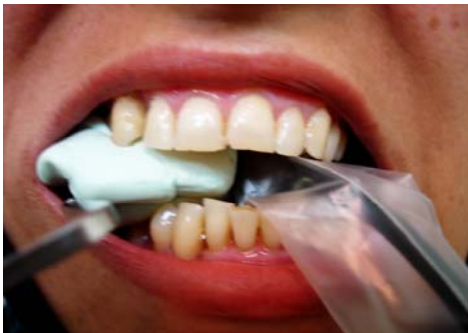
ب- sensor و template با XCP در دهان بیمار