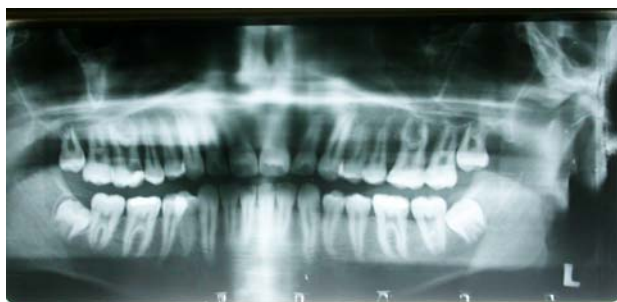
شکل ۲- هیپرتارودونتیسیم دو طرفه دندان مولر اول فک بالا در نمای ارتوپانتوموگرافی

بعد از تهیه رادیوگرافی پری آپیکال از این دندان، با توجه به ریشه‌های کوتاه و اتاقتک پالپ کشیده وجود تارودونتیسیم دندانی تأیید گردید. پس از تشخیص و نیاز به درمان ریشه، بیمار به اندودانتیست معرفی شد. لازم به ذکر است قبل از انجام درمان ریشه از بیمار رادیوگرافی Panoramic گرفته شد که نشان دهنده وجود تارودونتیسیم دو طرفه بود (شکل ۲).