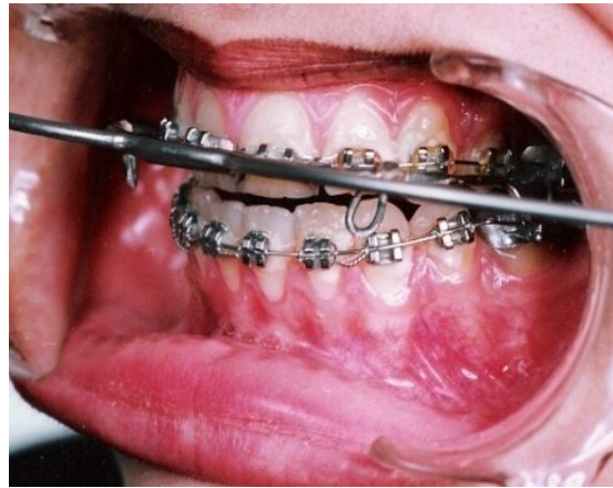
شکل 1 - LAHP در دهان

Lingual root torque بر روی دندان‌های قدامی فک بالا، قرار دادن Lingual crown torque در دندان‌های خلفی فک پایین و ایجاد Active labial crown torque در دندان‌های قدامی فک پایین انجام شد.