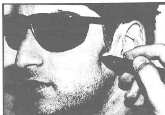
تصویر ۲- نحوه تابش لیزر بر نقاط خارج دهانی