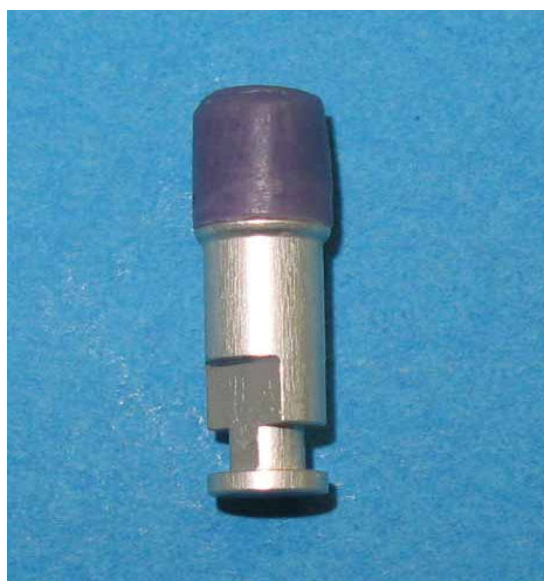
شکل ۲- مدل مومی finish شده روی مدل آزمایشی

درنهایت، مدل مومی روی مدل آزمایشی توسط یک برنیشر finish شد (شکل ۲).