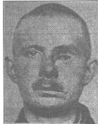
تصویر شماره ۳- بازسازی کاسه چشم (قبل و بعد از عمل) (۴)