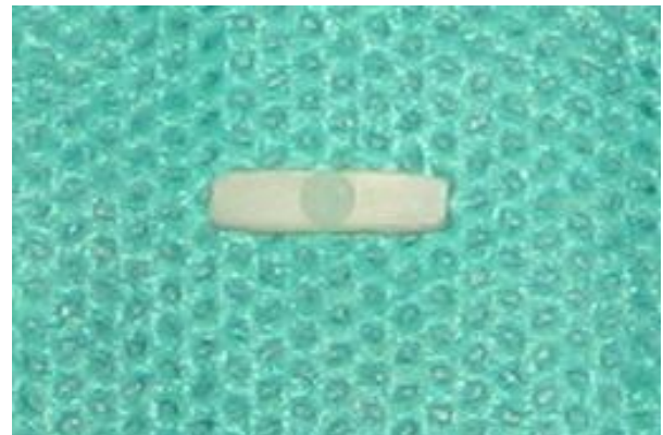
شکل ۲- نمونه‌های بعد از برش به صورت میله‌هایی بودند که کور کامپوزیتی در دو طرف و پست در مرکز قرار دارد.

(Isomet Saw, Buehler LTD, Lake Bluff, USA) استفاده شد. تمامی نمونه‌ها با سرعتی یکسان تحت خنک‌کننده آبی برش داده شدند. جهت قرارگیری نمونه‌ها در دستگاه برش عمود بر تیغه بود تا بتوان برشهایی عرضی از هر نمونه به دست آورد و در نهایت ۴ برش هریک به ضخامت ۱ میلی‌متر از هر نمونه اولیه حاصل شد. بدین ترتیب ابعاد نهایی نمونه‌ها ۱×۲×۹ میلی‌متر بود (اشکال ۲ و ۳).