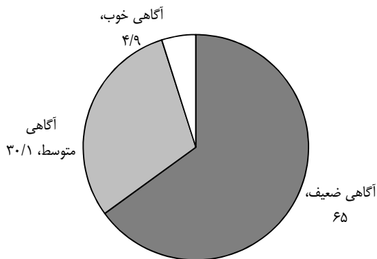
نمودار ۱- توزیع ۳۸۵ نفر بر حسب میزان آگاهی از مفهوم کلمه جراح- دندانپزشک، تهران، سال ۹۰-۱۳۸۹

میزان ۶۷/۸٪ بود، که جراح-دندانپزشک را همان متخصص جراحی فک و صورت قلمداد می‌کردند.