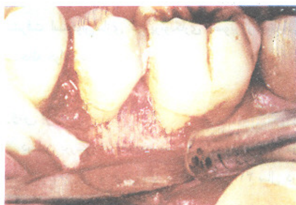
تصویر شماره ۴- باز کردن، ترمیم و بررسی ناحیه پس از ۶ ماه