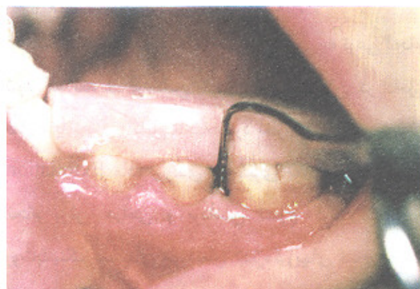
تصویر شماره ۱- عمق پاکت (M|6) قبل از عمل در بیمار گروه آزمایش

جلسات مراجعه بیماران به طور منظم ماهی یک‌بار انجام شد و ۶ ماه پس از جراحی اول جراحی Re-Entry انجام گرفت. پس از انجام فلپ موکوپریوستال در ناحیه مورد نظر، مجدداً اندازه‌گیریهای نسج سخت تکرار شد (تصویرهای شماره ۱ تا ۴).