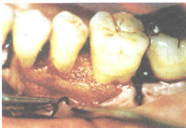
تصویر شماره ۳- گذاشتن ماده پیوندی در داخل ضایعه